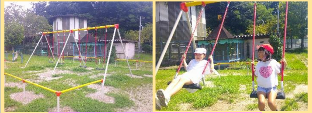
新しいブランコが完成しました！