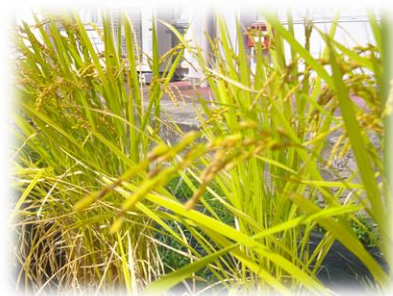
首を垂れる稲穂かな